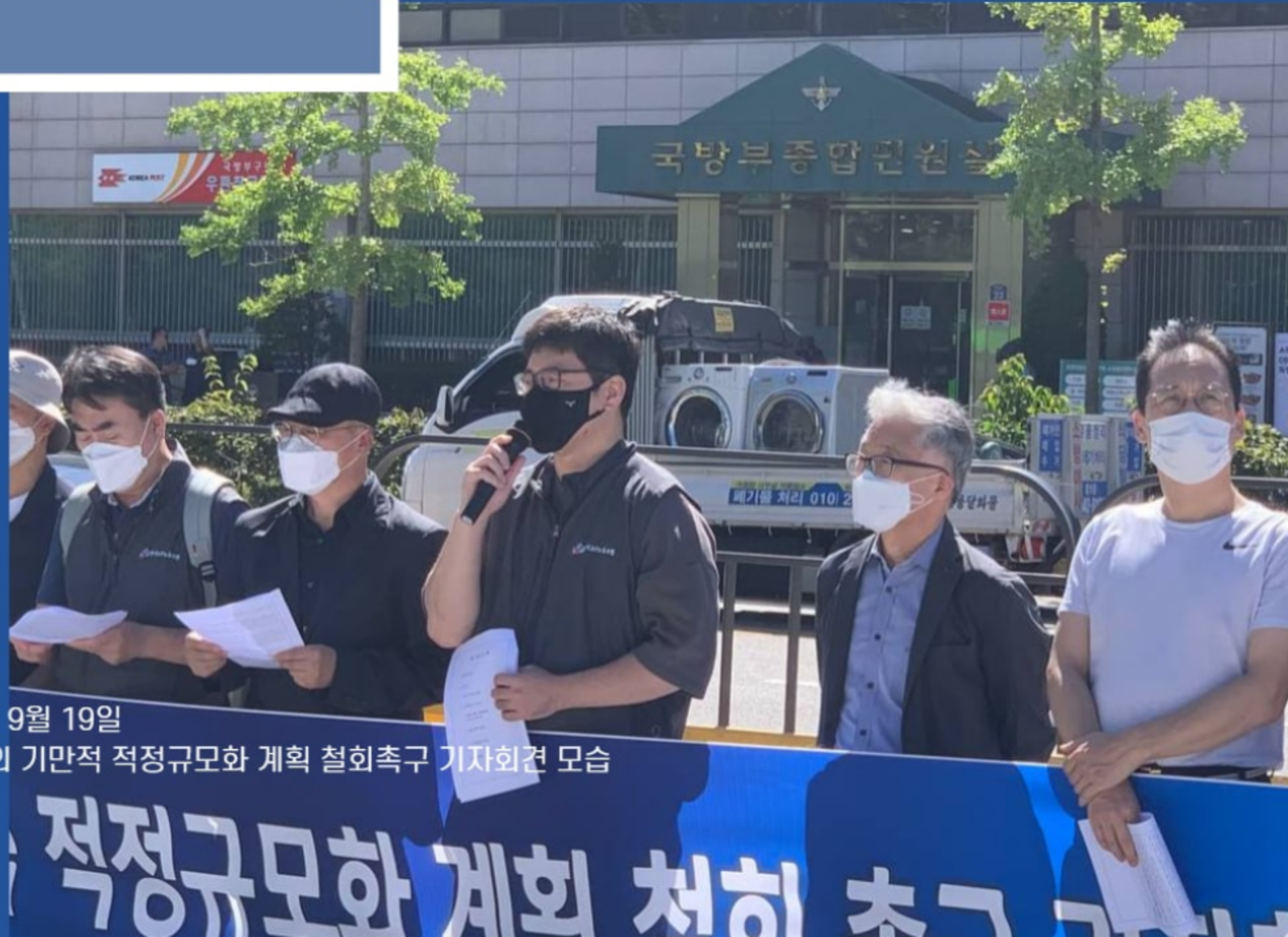
2022년 9월 19일 교육부의 기만적 적정규모화 계획 철회촉구 기자회견 모습