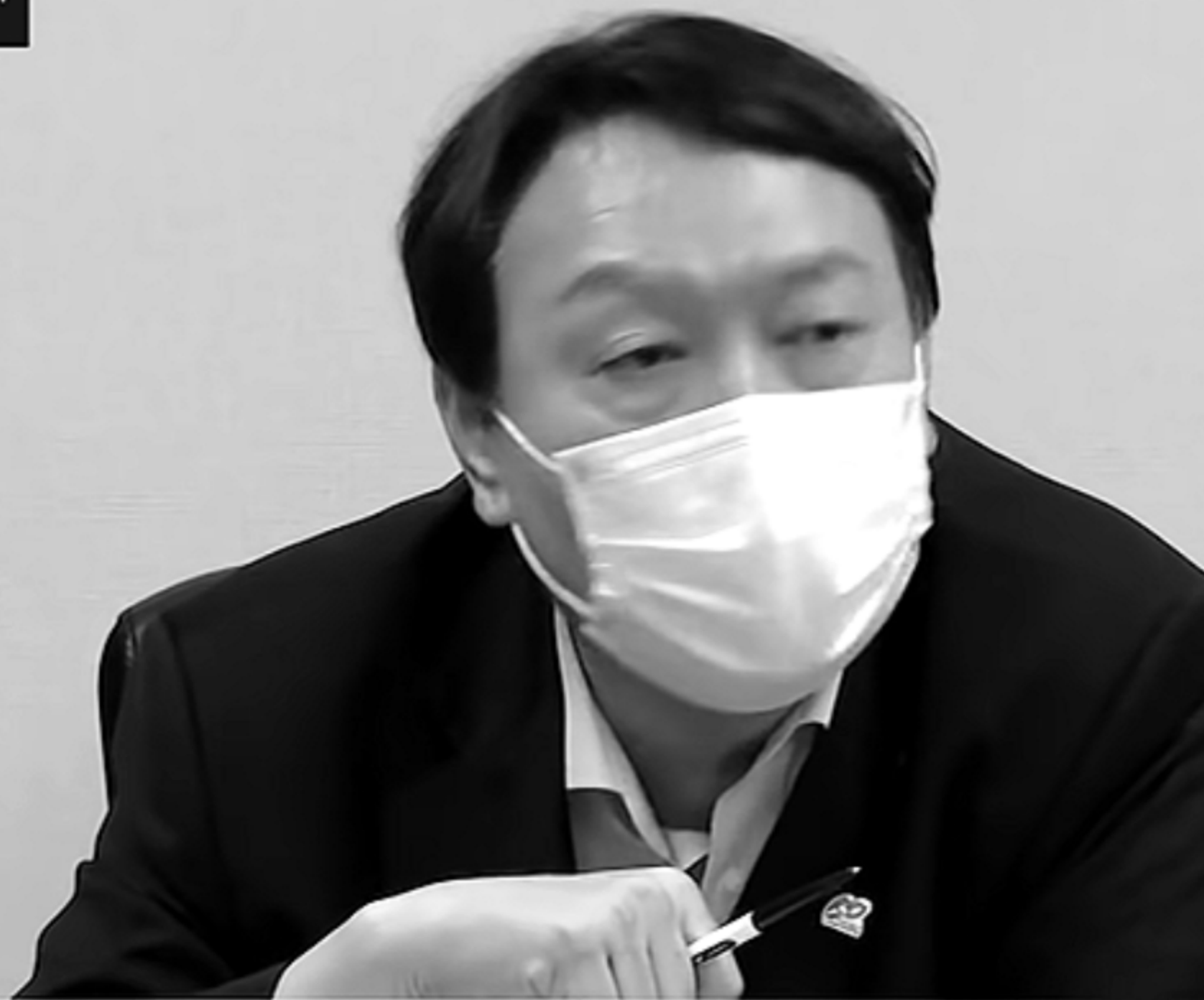
윤석열 전 검찰총장